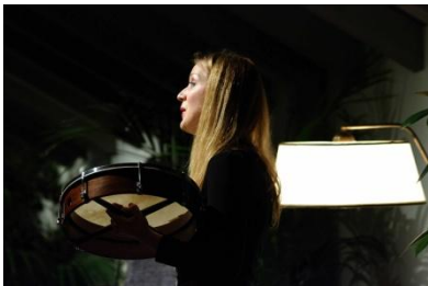
(Florence, Italy 2014)