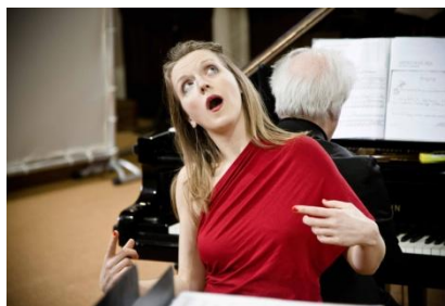
(Blois, France, 2013)